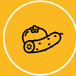
PRODUCTOS FRESCOS VEGETALES Y HORTOFRUTÍCOLAS