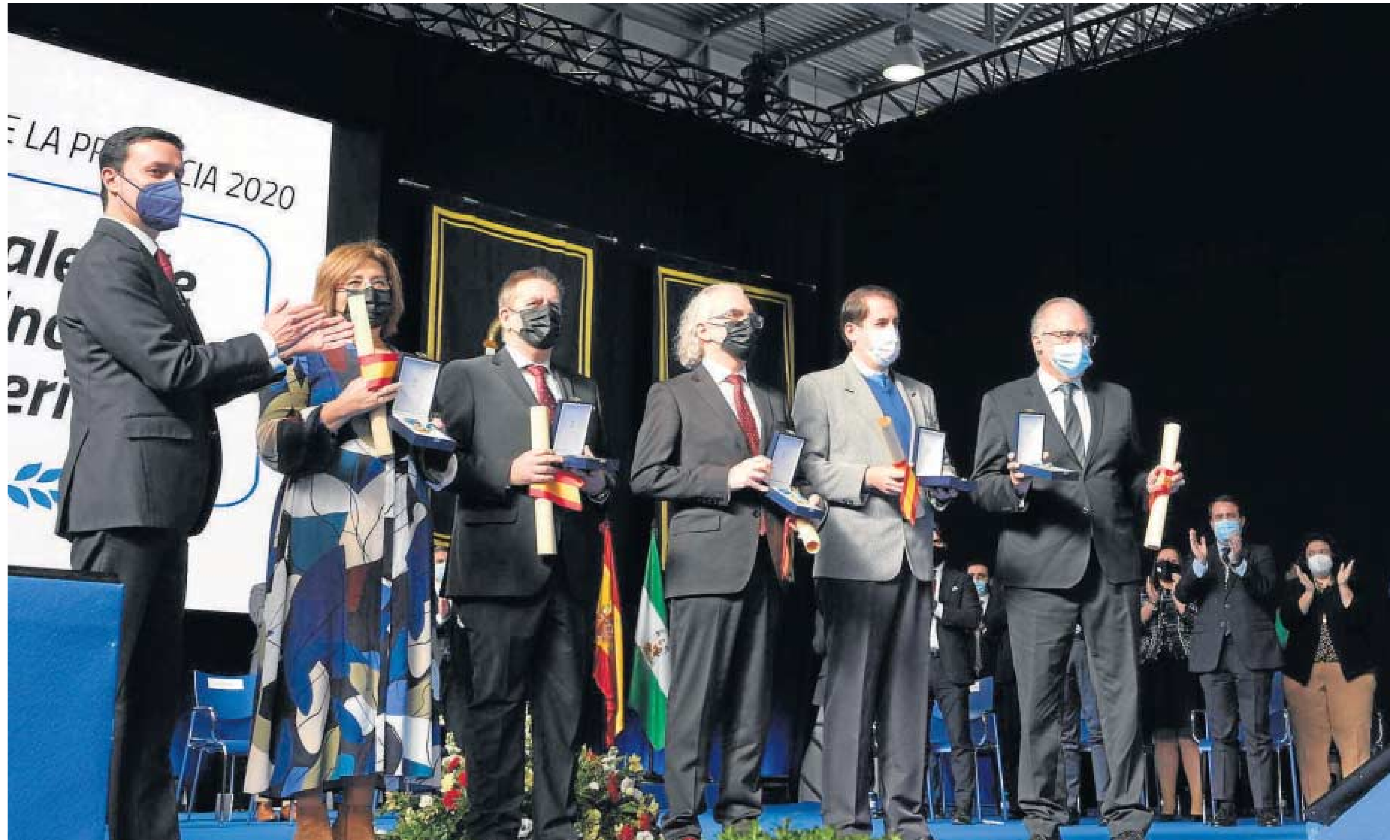
El presidente de Diputación con los representantes de los hospitales Virgen del Mar, Poniente, Torrecárdenas, Mediterráneo y La Inmaculada, medalla de oro.