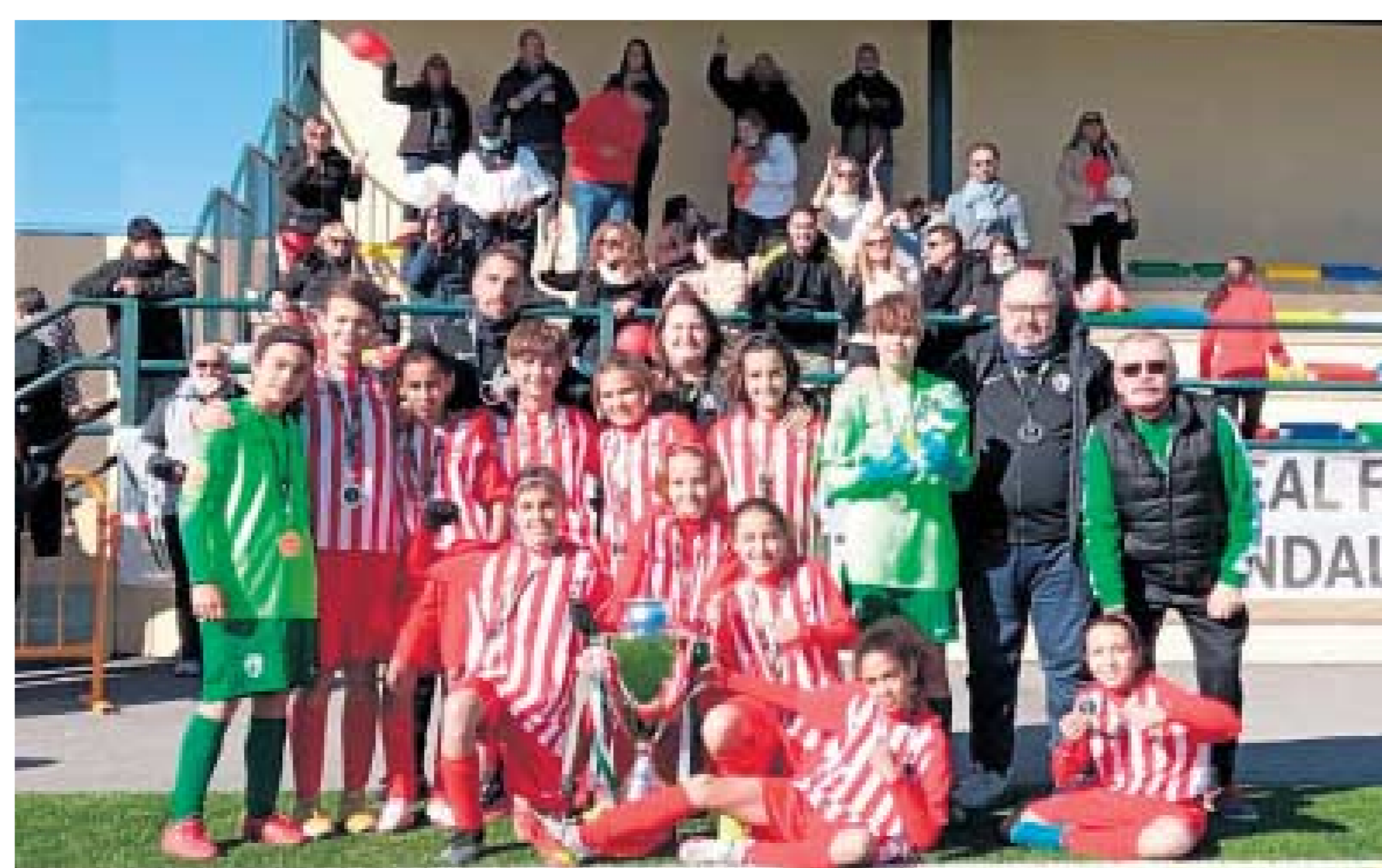
Las chicas de la selección sub-12, con la Copa de campeonas.